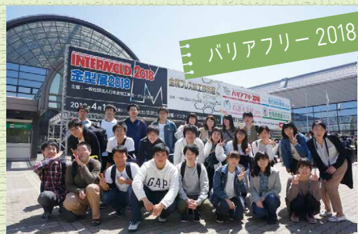
リハビリテーションに関する機器の最新情報を知ることができました。