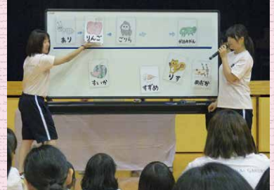
学生主体で子どもたちへの関わりを計画・実践