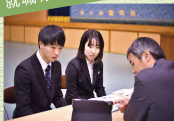
真剣な表情です。毎年たくさんの施設や病院から参加していただいています。