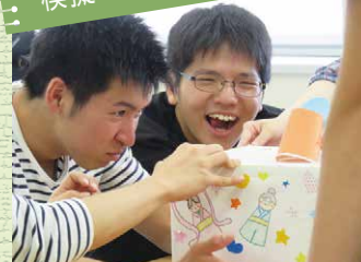
自分たちで考えたものを発表! 実践型の授業です。