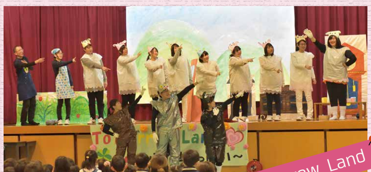
子どもたちの前で、授業で学んだオペレッタや人形劇などを披露