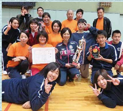
主催/徳島市学生生徒補導連絡協議会