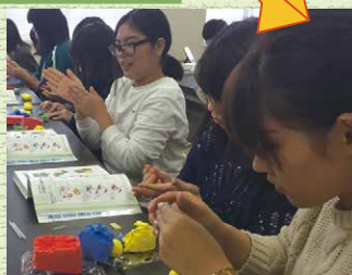
粘土で脳のパーツを作成し構造を勉強しました。