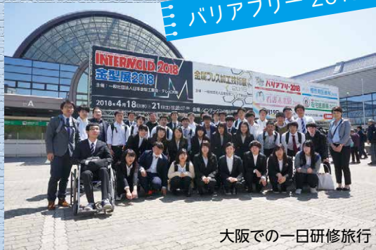
大阪での一日研修旅行