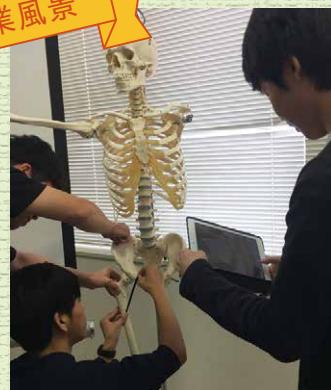
タブレットを使って体の動きを学びます。