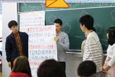
新しい仲間と目標を決めよう!