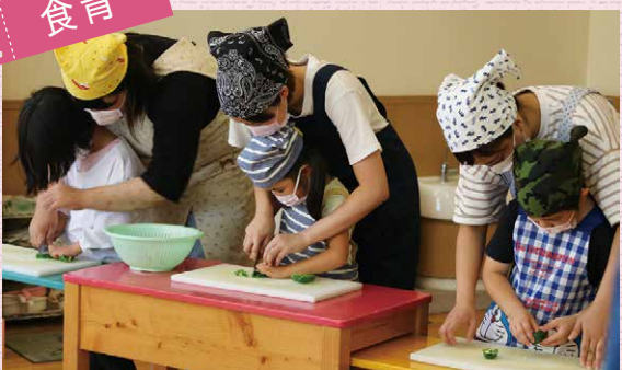
子どもたちのクッキング