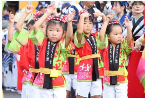
阿波踊り（健祥会ちろど連）