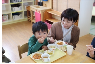
保育参加・親子ランチタイム